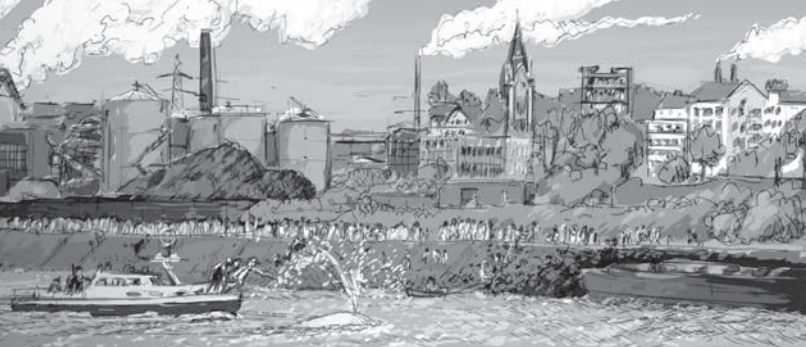
Illustration: Bruno Schulte

Von der Geschichte um den weißen Wal im Rhein hat so ziemlich jeder schon einmal gehört und man könnte meinen, es handele sich um das Drehbuch für einen Spielfilm: Vor 50 Jahren, am 18. Mai 1966, melden Rheinschiffer die Sichtung eines Wals auf Höhe Neuen-