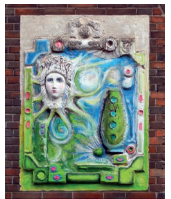
Pommeserei am Ludgerplatz

Beilagen ver(z)ehrt werden. Welcher Ort ist hier gemeint?