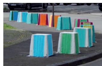
Die Pöller kurz vor ihrer Fertigstellung