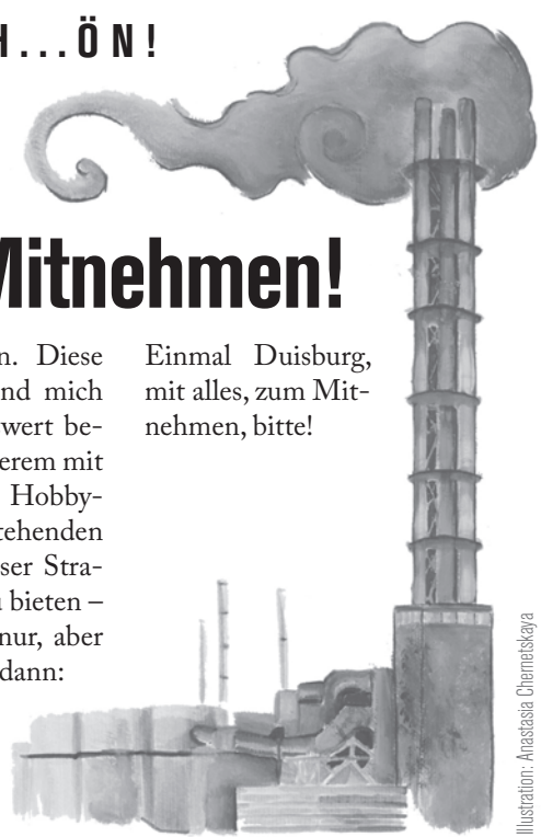
Illustration: Anastasia Chernetskaya

Einmal Duisburg, mit alles, zum Mitnehmen, bitte!